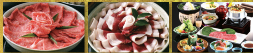
特選 丹波牛しゃぶしゃぶ 名物 ぼたん鍋 冬の会席料理 【飲み放題付き】 瓶ビール・熱燗・焼酎・ソフトドリンク

幹事さん楽々!! 8,000円(税別)~の 選べるお料理・温泉三昧・120分飲み放題